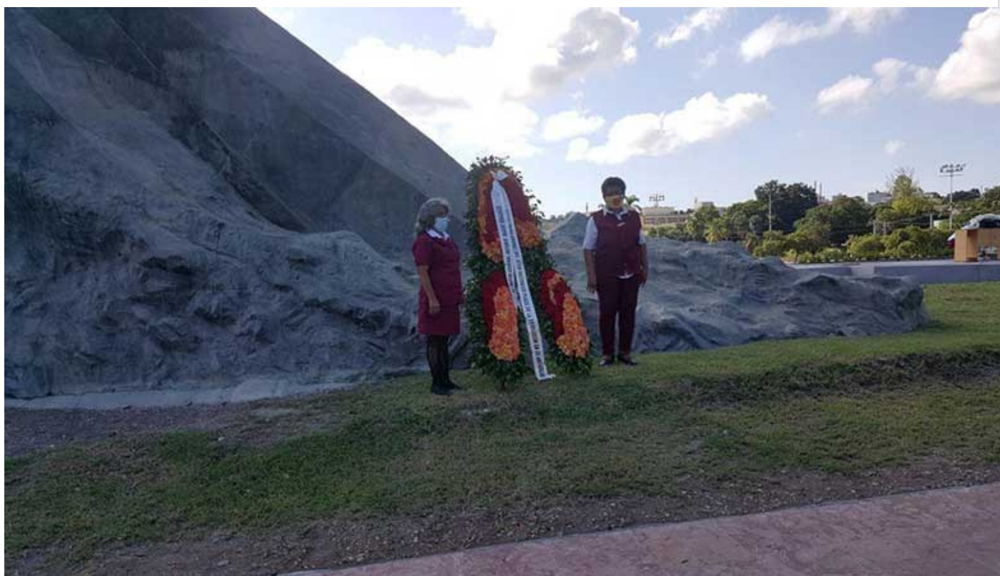
Plaza de la Revolución de Santiago de Cuba.

Santiago de Cuba, 15 oct (RHC) Con el coloquio “Plaza, símbolo para una historia” comenzó la celebración la víspera de los 29 años de la plaza de la Revolución “Mayor General Antonio Maceo Grajales”, emblema de la vida política, cultural y social de la ciudad de Santiago de Cuba.