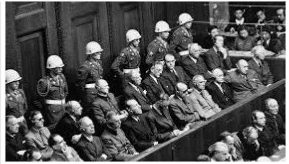
Juicio de Nuremberg

La sala del tribunal en Nuremberg se ha conservado y todavía atrae a muchos visitantes para ver el lugar donde acusados ??como Hermann Göring escucharon sus condenas a muerte.