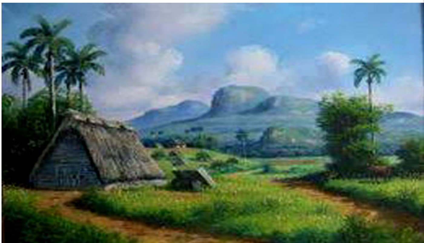
Bohío Vara en tierra

La necesidad de protegerse y sobrevivir a esos terribles vientos junto a las lluvias torrenciales, convirtieron a las cuevas en el primer refugio natural de los aborígenes.