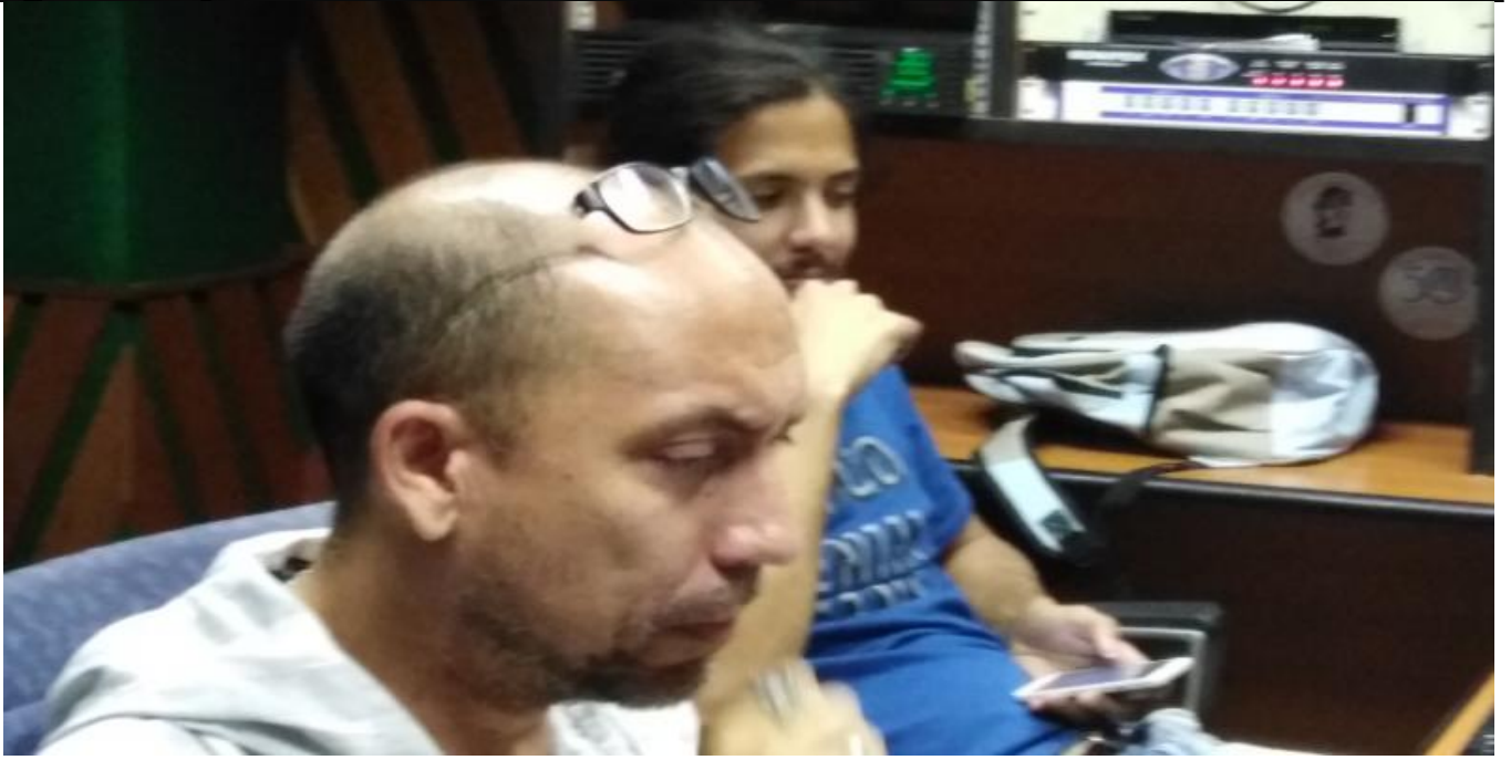
Estudio Orlando Castellanos