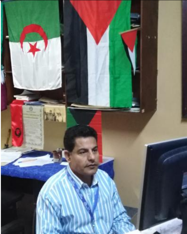
Redacción de árabe

El Día Mundial de la Radio se celebra hace solo 8 años, cuando la Asamblea General de las Naciones Unidas aprobó la propuesta hecha entonces por la UNESCO con ese fin. Se escogió el 13 de febrero por haber sido el día del nacimiento de la radio de la ONU, en 1946.