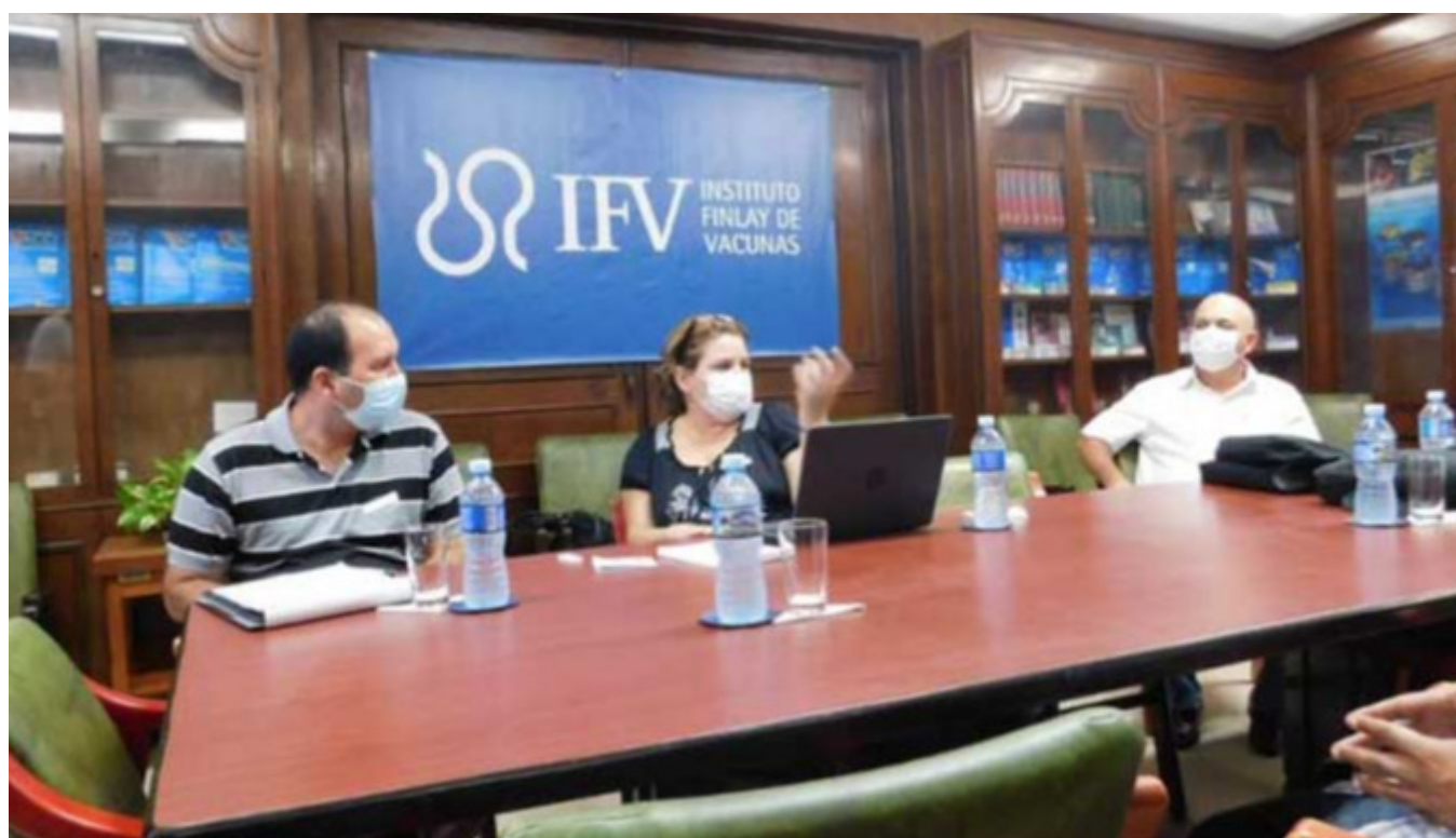
Morales Ojeda (D) dialoga con sus anfitriones sobre la estrategia de Soberana 01.

La Habana, 21 sep (RHC) El viceprimer ministro de Cuba, Roberto Morales Ojeda, realizó este lunes una visita de trabajo al Instituto Finlay de Vacunas (IFV), en La Habana, para verificar la marcha de los proyectos del centro, especialmente el de Soberana 01, la vacuna del país contra la COVID-19.