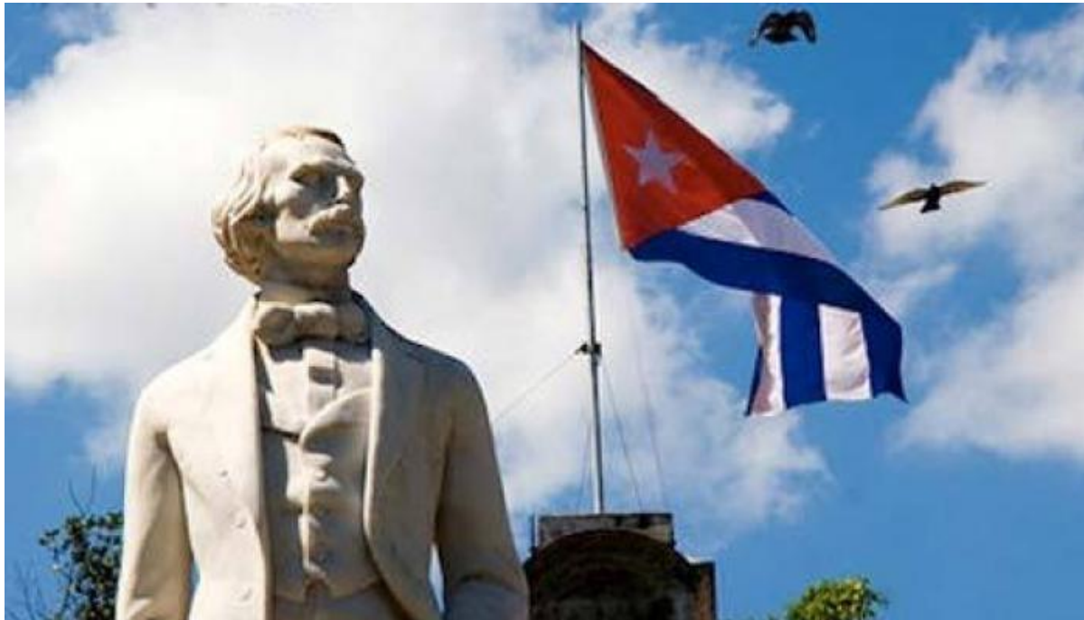
Carlos Manuel de Céspedes, la patro de la patrio

La 10-an de oktobro komenciĝas en Kubo agotagoj por la nacieco kaj kulturo, memore al la