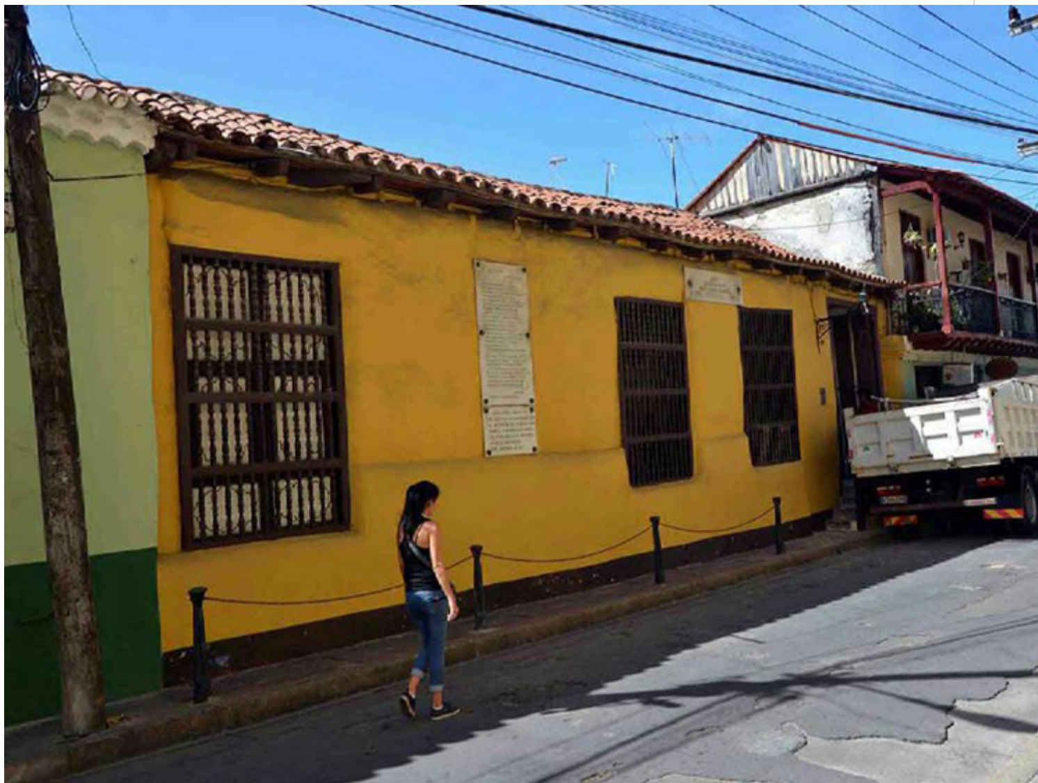
Museo Casa Natal José María Heredia en Santiago de Cuba.

Santiago de Cuba, 14 oct (RHC) El Museo Casa Natal José María Heredia, ubicado en una casona de arquitectura colonial construida a mediados del siglo XVIII, recibe una restauración con la intervención de estudiantes y sus profesores en las diferentes especialidades de la Escuela Taller Ugo Luisi, de la Oficina del Conservador de la Ciudad de Santiago de Cuba.