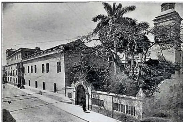
Convento de Belén 1925

Dirigido por los padres y las monjas de la Orden de Belén, en 1718, esta institución se dedicó en un principio a la enseñanza primaria de niños y jóvenes, era la única gratuita hasta 1854 en que se hizo entrega de todo el edificio a los padres jesuitas para el establecimiento del real colegio de La Habana.