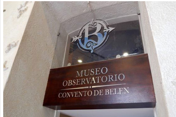
Museo observatorio Covento de Belén

Gracias a proyectos de cooperación en 1996 se inauguró la Iglesia restaurada. Paulatinamente se fue trabajando en la recuperación de todo el conjunto religioso se devolvió el esplendor de los espacios dedicados a las ciencias, como la torre noroeste del edificio, donde se halla hoy el primer Museo Meteorológico de Cuba.