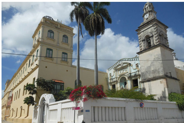
convento de Belén

En la actualidad radican en Belén la Oficina de Asuntos Humanitarios de la Oficina del Historiador, junto a importantes áreas especializadas que se encargan de velar por la salud, la protección y el bienestar de los adultos mayores. Para ello, cuentan con los centros diurnos, las residencias protegidas, la residencia interna donde los ancianos asisten a talleres, reciben fisioterapia, poseen una alimentación adecuada y cuentan con personal de salud especializado.