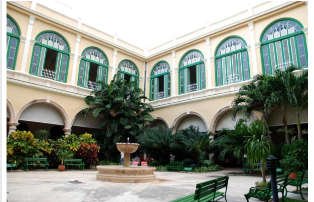
patio del Convento de Belén

Las obras del hospital y de la iglesia comenzaron en 1712 y en 1720 se dieron por concluidos el colegio, la escuela y la enfermería, que abarcaban el primer claustro.