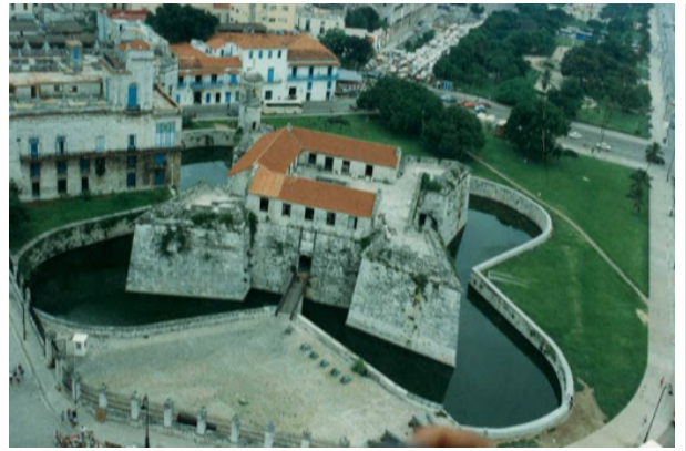
Área del Castillo de la Real Fuerza

Carreño era hombre de armas tomar. Se distinguió como navegante en la era de los descubrimientos y luego se enfrentó a indios y a corsarios y piratas en Nicaragua y Cartagena de Indias. Por su valor lo nombraron gobernador de Panamá en tiempos de las revueltas sangrientas que protagonizaron Lope de Aguirre y sus «marañones». Felipe II lo designaría Almirante de la Armada Invencible, y cuando la Armada Invencible fue vencida, el monarca no lo dejó de la mano, pero le confió un puesto menor, tan menor como aquel de Gobernador General de la Isla de Cuba en una época de gran pobreza pública y de sobresaltos continuos por las amenazas de los piratas.