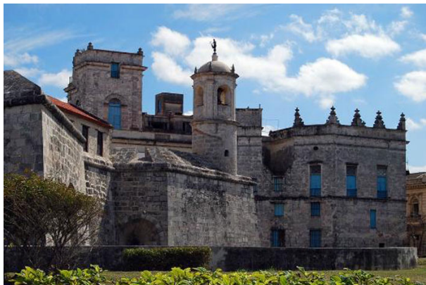
Castillo de la Real Fuerza