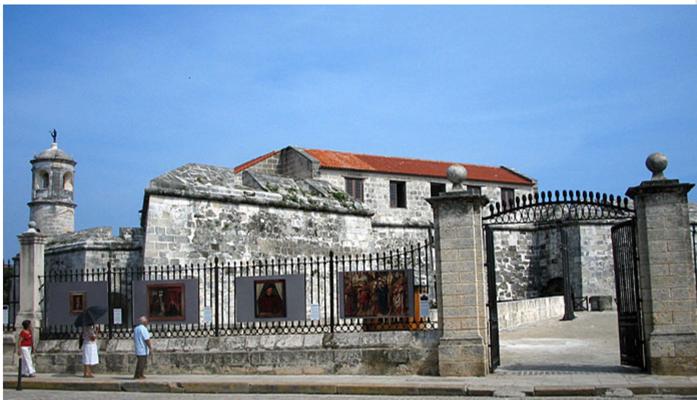
Castillo de la Real Fuerza

El castillo de la Real Fuerza es la fortaleza más antigua de La Habana, y, por lo mismo, una de las joyas más preciadas con que cuenta la ciudad. Ha sido, sin embargo, la más discutida de todas las defensas de la urbe y tanto fue el empeño en demolerla que pusieron de manifiesto no pocos capitanes generales, que bien puede afirmarse que ha llegado a nosotros por puro milagro.