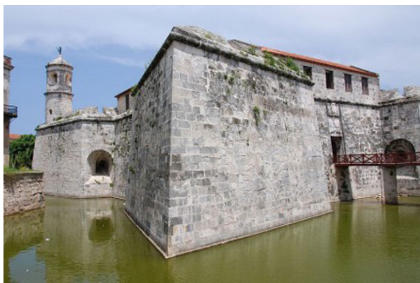
Pozos del Castillo Real Fuerza

La golosina más inocente consiguió lo que en años no lograron corsarios y piratas, los indios bravos de Nicaragua y los temidos «marañones» de Lope de Aguirre. Un comedor de plomo, diría Álvaro de la Iglesia en una de sus Tradiciones cubanas, no pudo digerir un dulce.