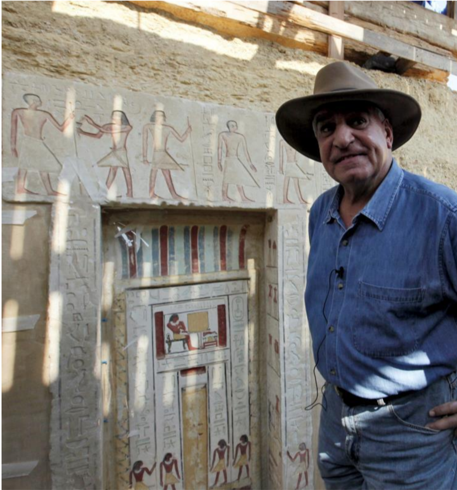
Encuentran en Egipto bajo la arena una gran ciudad perdida de 3.000 años/EFE

El Cairo, 10 abr (RHC).- El Gobierno egipcio confirmó el hallazgo bajo la arena en la monumental Luxor de una gran ciudad de unos 3.000 años de antigüedad que se hallaba perdida y que se encuentra en un buen estado de conservación.