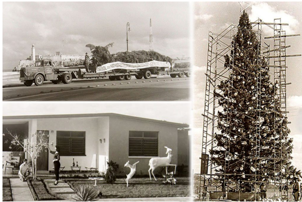
Árbol de Navidad gigante

Pronto Fontanar cobró auge al convertirse en sitio preferido por actores, periodistas, celebridades de la radio y la televisión que fabricaron allí su vivienda.