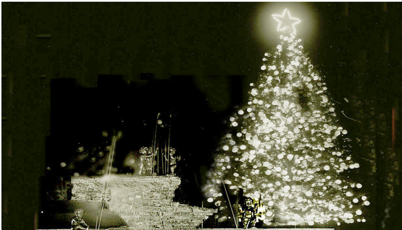
Árbol de Navidad del reparto Fontanar

El reparto Fontanar se erigió, a partir de 1956, en los terrenos de la finca San José o Retiro de Vento, dedicada a la siembra de la caña de azúcar para el central Toledo.