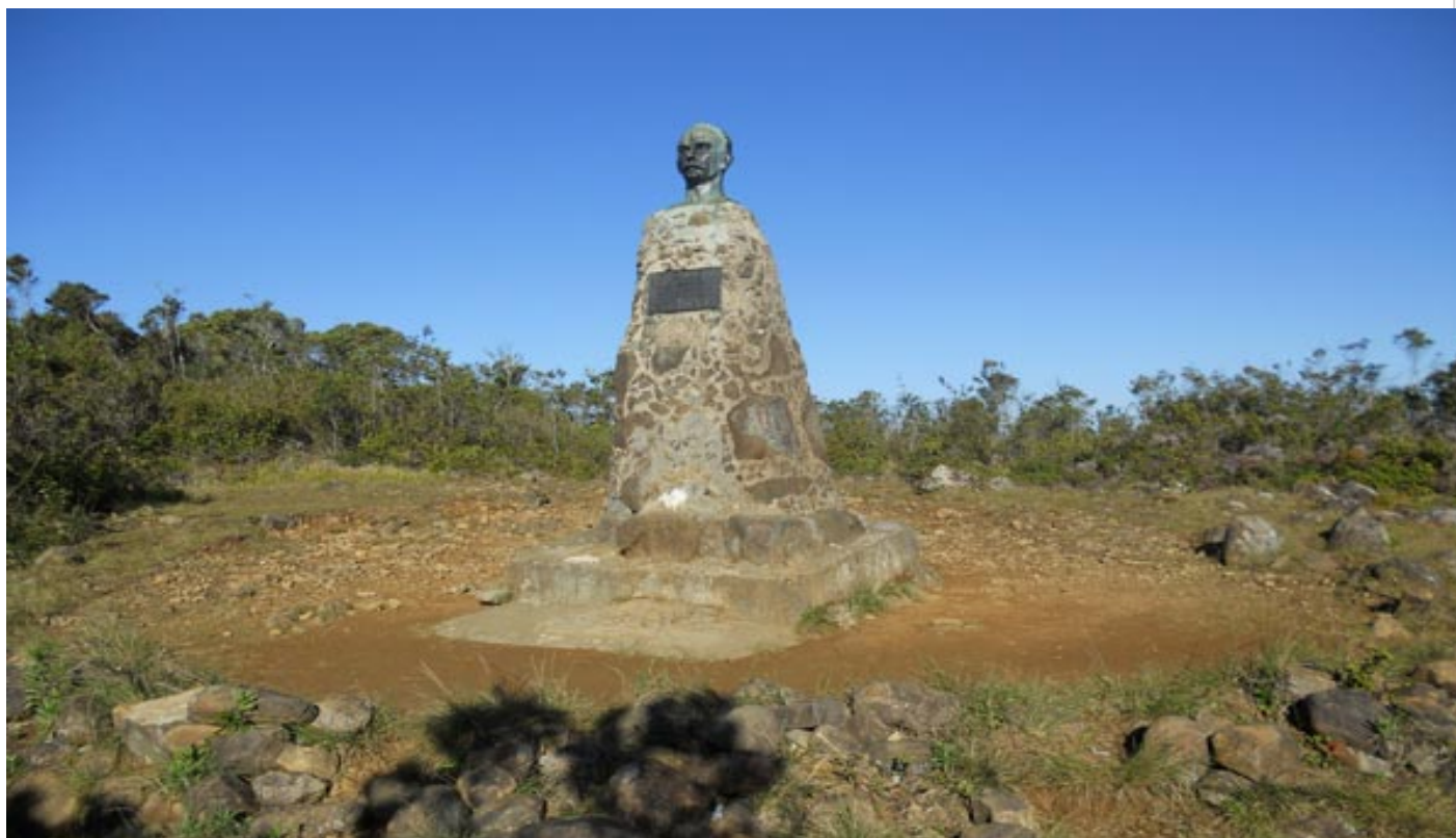
Busto de José Martí en el Pico Turquino