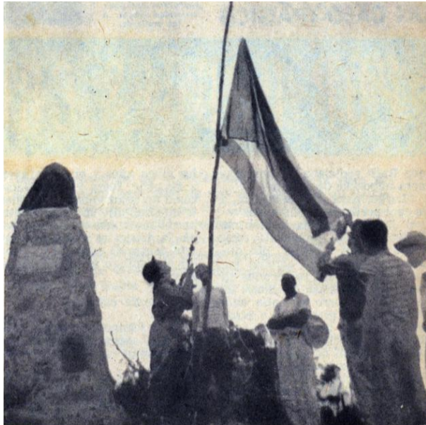
Izan la bandera cubana frente al busto de Martí

«Escasos, como los montes, son los hombres que saben mirar desde ellos, y sienten con entraña de nación, o de humanidad»