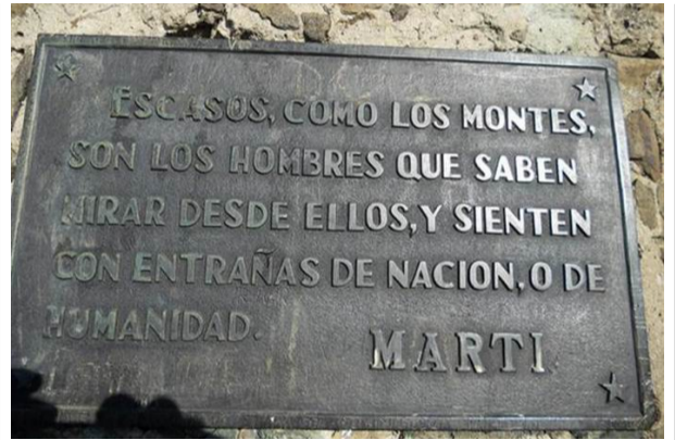
Tarja en la base del busto de José Martí

La tarja que está ubicada exactamente en la base del busto lleva grabado lo expuesto por Martí, en la carta que le escribió a su amigo dominicano Federico Henríquez y Carvajal, el 25 de marzo de 1895.