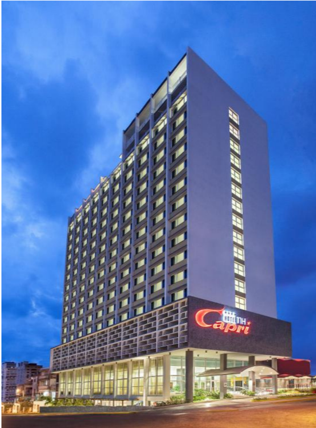
Hotel Capri/La Habana

Si alguna noche usted nota el Capri apagado, no necesariamente es que se averió algo o hubo un corte, quizás estén celebrando La hora del Planeta, una experiencia que también comparten con los clientes. Obvio que no los obligan a permanecer en "apagón", los convocan, crean atmósferas agradables con velas, pero insisten en la importancia de darle un respiro al Medio Ambiente, al menos durante una hora: