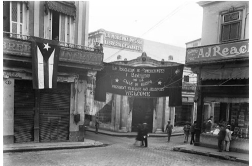
La Moderna Poesía