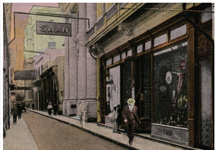
Calle Obispo, postal antigua