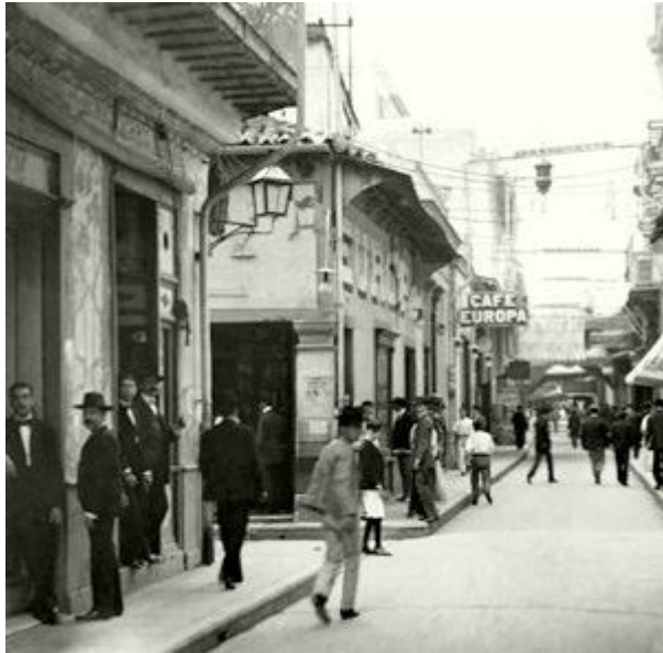
Café Europa silo XIX

Obispo era entonces, dice Federico Villoch en sus Viejas postales descoloridas, «la calle de La Habana», la vía más comercial de la ciudad. Fue hasta 1915, junto con O'Reilly, meca del comercio y la moda, como lo eran de las secretarías de despacho (ministerios), la banca y los bufetes de prestigio. En Obispo hallaban asiento la mejor heladería, la dulcería más solicitada, la farmacia más confiable, las librerías más actualizadas, joyerías de renombre como La Casa de Hierro o el Palais Royal, tiendas como La Villa de París y La Francia. Una sastrería reputada como la del padre de Julio Antonio Mella, se localizaba asimismo en esta calle, al igual que El Pedregal, un expendio de semillas de mucha calidad y alto poder de germinación.