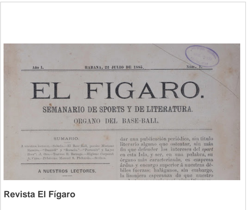
Revista El Fígaro

El Fígaro apareció en 1885 como un «semanario de sports y literatura; órgano del baseball». Con el tiempo fue cambiando su subtítulo hasta que en 1894 apareció como un «periódico artístico-literario». Esta revista, dirigida a la burguesía, reflejó las principales actividades de esa clase social, bien a través de la crónica, el grabado y la fotografía, pero lo que le dio todo su valor y trascendencia fue su vínculo con el movimiento modernista. Por sus páginas y por su Redacción, en Obispo casi esquina a Aguiar, pasó lo mejor de ese movimiento literario: Casal, Juana Borrego, Carlos y Federico Urbach, entre los del patio, y Rubén Darío, Santos Chocano, Nervo, Icasa, Blanco Fombona, Nájera... entre los de fuera. Solo faltó