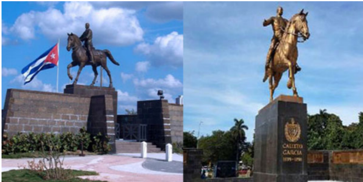
Estatua del Mayor General Calixto García

La estatua del Mayor General Calixto García, héroe de las Guerras de Independencia en Cuba en el siglo XIX, ha cambiado de locación, de su emplazamiento en la calle G, Avenida de los Presidentes, en el barrio del Vedado, en el malecón habanero donde permaneció por más de 55 años, ha sido trasladada a la 5ta. Avenida de Miramar, exactamente en la calle 146.