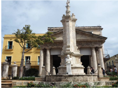
Monumento columna de tres caras

Cuando se derribó dicha iglesia, en 1777, la tarja fue trasladada a la esquina de Obispo y Oficios, casa solariega de los Cepero, y allí estuvo hasta que pasó a formar parte de las colecciones del Museo Nacional, en 1914. En 1937 el monumento se restituyó a su espacio original, ocupado entonces por el Ayuntamiento habanero, y allí estuvo hasta encontrar su sitio definitivo.