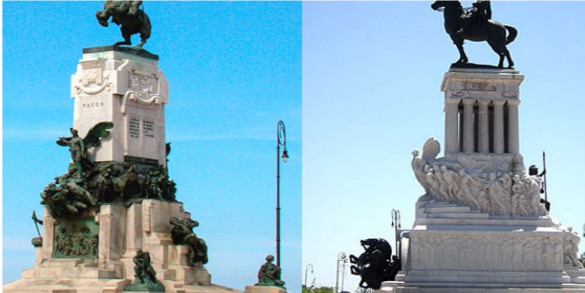
Monumentos de Antonio Maceo y Máximo Gómez

¿Por qué si Antonio Maceo y Máximo Gómez fueron igualmente guerreros, el caballo del primero, en el monumento del parque que lleva su nombre, frente al hospital Hermanos Ameijeiras, tiene las patas delanteras levantadas, mientras que en el del otro patriota, en una de las bocas del Túnel de La Habana, se apoya en sus cuatro extremidades?