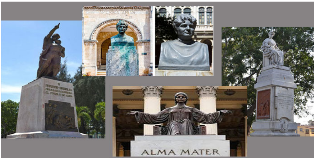
Estatuas: Mariana Grajales, América Arias, Emilia de Córdoba y Alma Mater