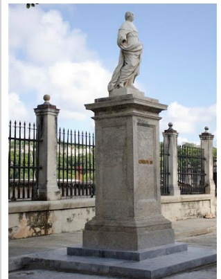
Monumento a Carlos III