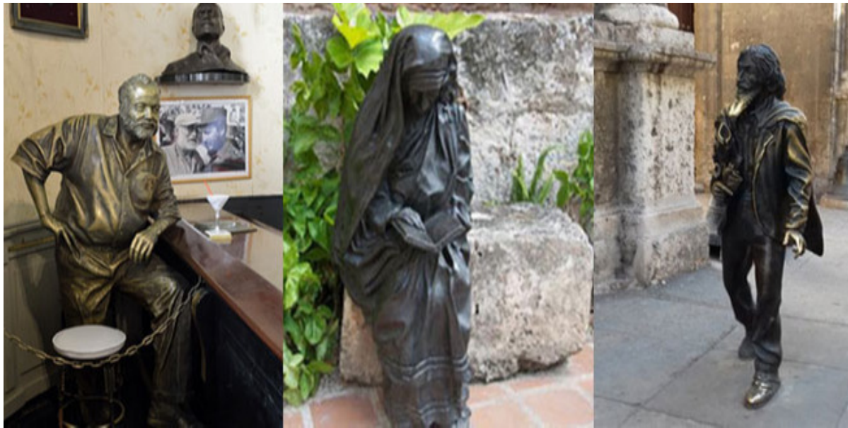
Ernest Hemingway, El Caballero de París y Madre Teresa de Calcuta