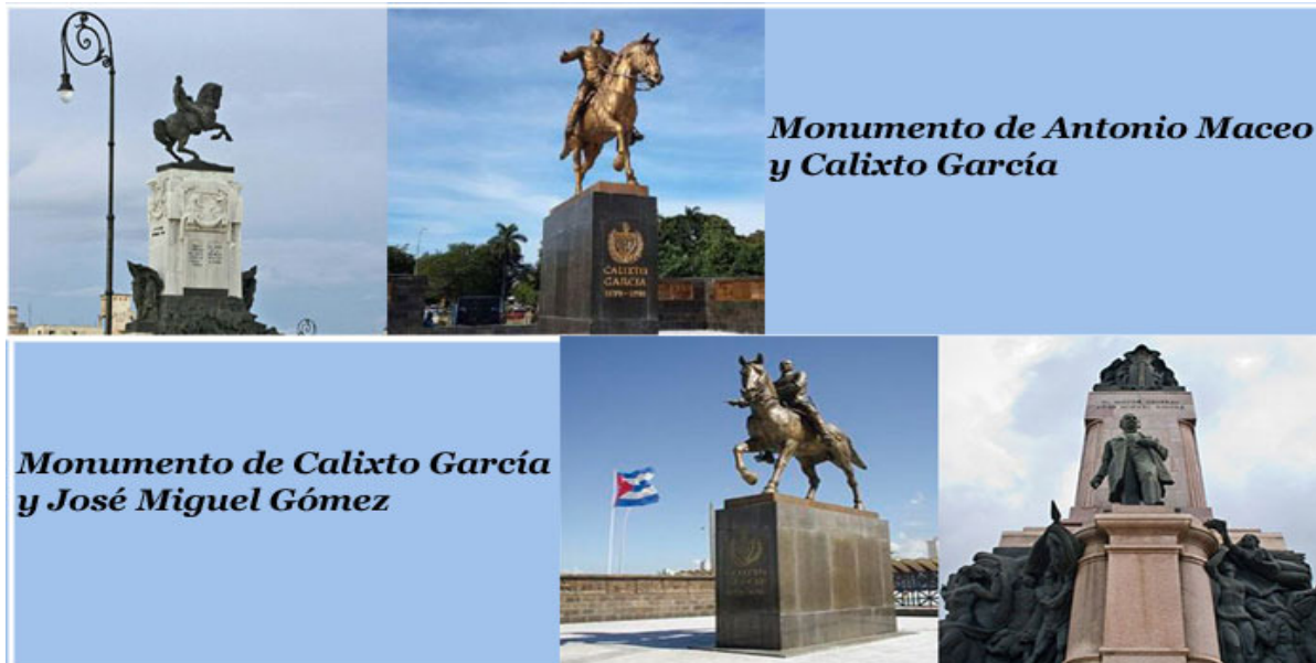
Monumento de Antonio Maceo y Calixto García