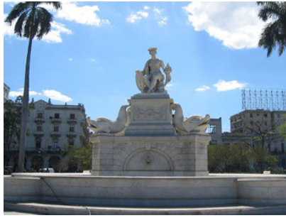
Fuente de la India

De un lugar a otro anduvo también La Fuente de la India, conocida asimismo como de La Noble Habana.