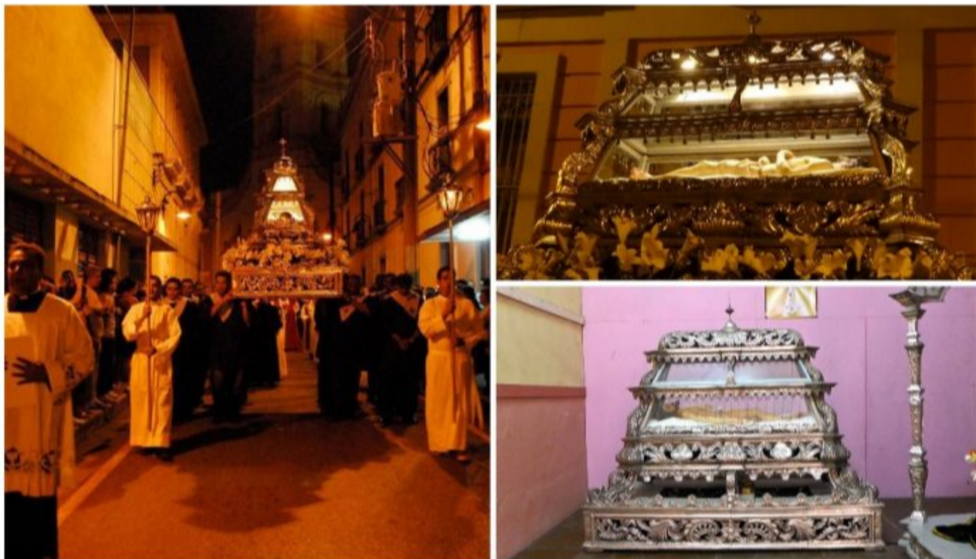
Santo Sepulcro de Camagüey