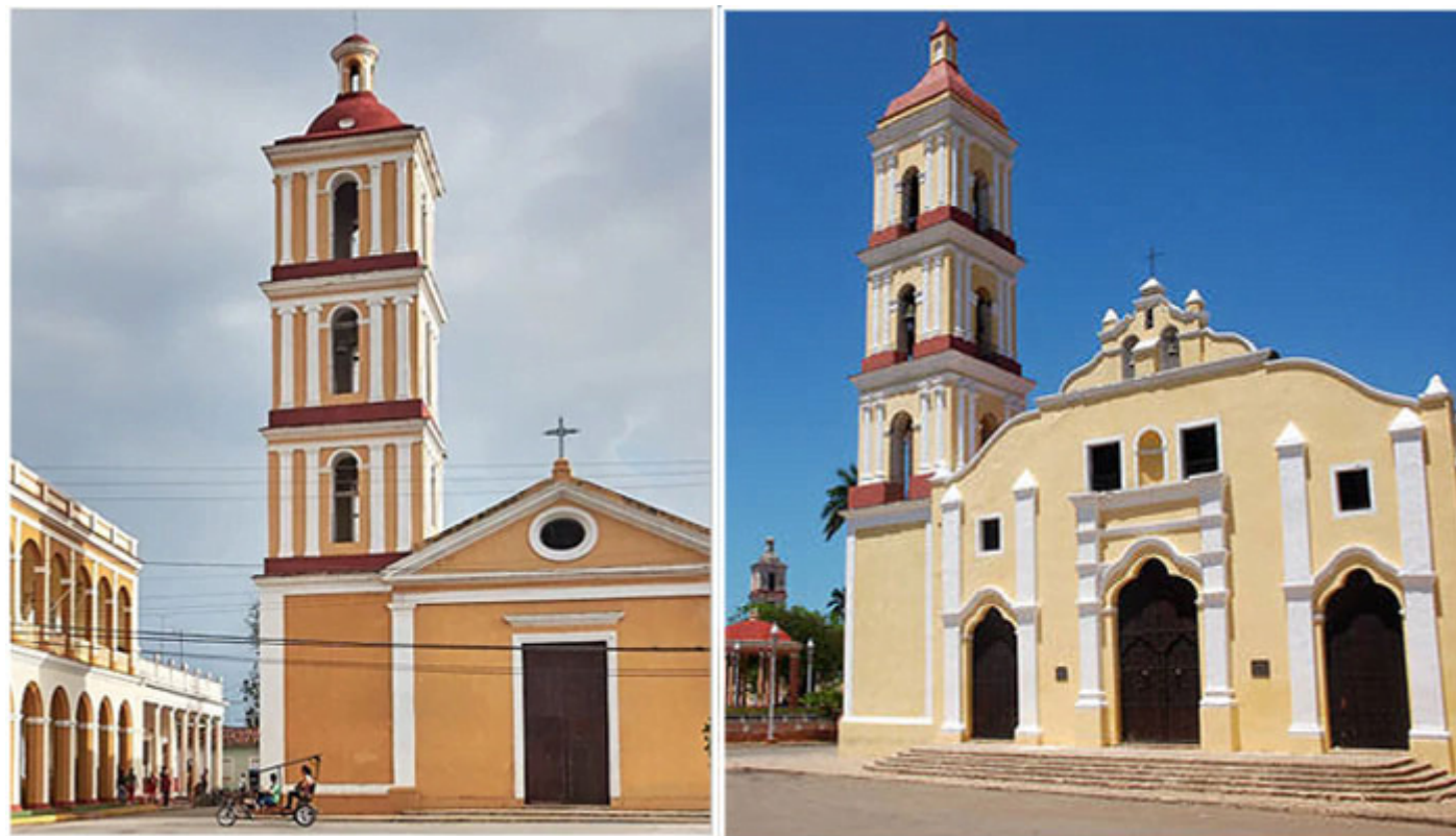
Iglesia de Nuestra Señora del Buen Viaje y la Parroquial Mayor de San Juan Bautista en Remedios