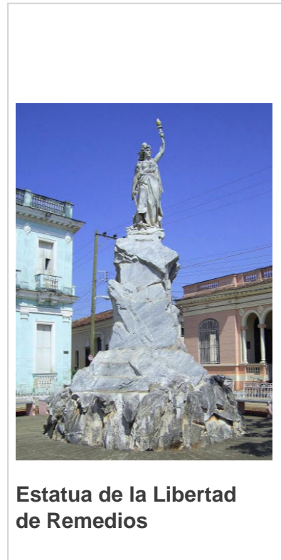
Estatua de la Libertad de Remedios

Esas piezas de bronce o hierro, de singular valor estético y patrimonial, que penden todavía en las puertas de antiguas casonas, devienen, igualmente, elemento distintivo de esta ciudad.