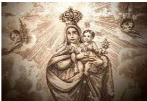
La virgen del Buen Viaje en Remedios

De acuerdo con la leyenda, inicialmente la dejaron en la casa de un anciano lucumí para que este informara sobre el hallazgo al cura, y trasladara después la imagen a la parroquia. Este decidió dejarla en su casa, pero cuando descubrieron que no había cumplido con su palabra, autoridades y pobladores llevaron la imagen de Nuestra Señora del Buen Viaje en procesión hacia la iglesia del pueblo. Cuenta la tradición oral que la nueva virgen desapareció a la mañana siguiente de haberse situado en la iglesia y la encontraron después en casa del anciano lucumí.