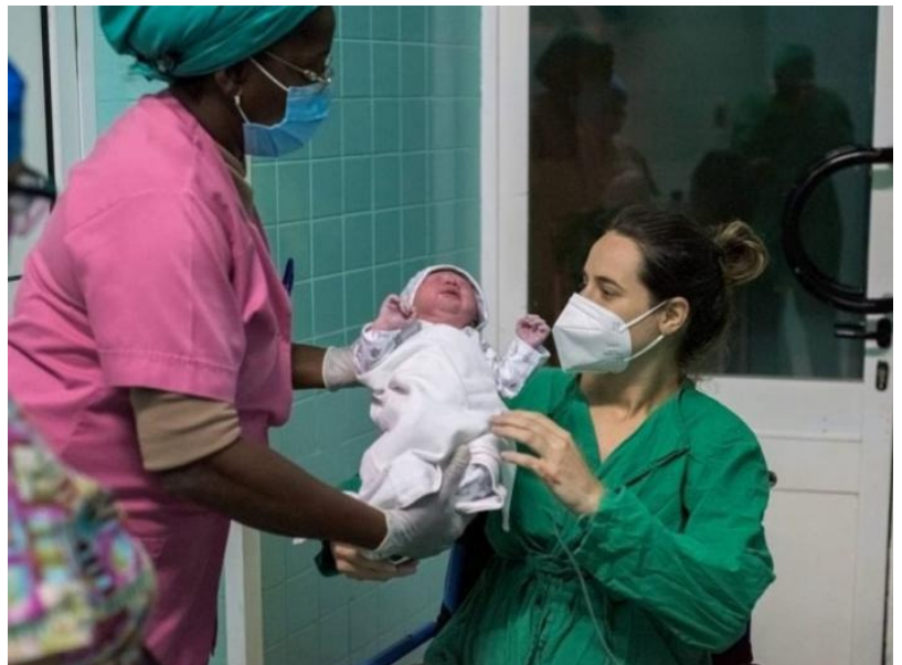
Bebé nacido sano

Cuando en el mundo se reportaban casos y se hablaba de que los menores de edad no iban a enfermar