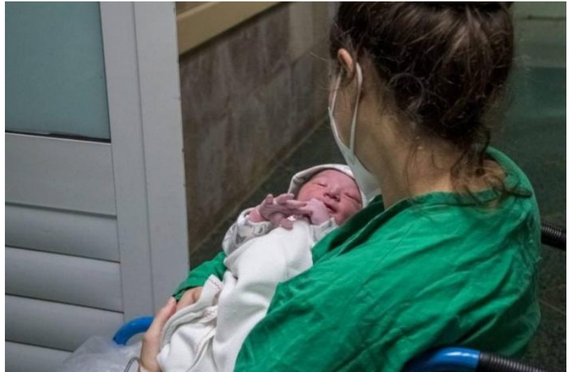
Atención a la madre y al bebé

La Jefa Nacional del PAMI mencionó que darán máxima prioridad a las acciones encaminadas al control de las embarazadas con enfermedades crónicas previas a la gestación, así como a las que aparezcan durante el embarazo, parto o el puerperio. (Tomado del Sitio del MINSAP)