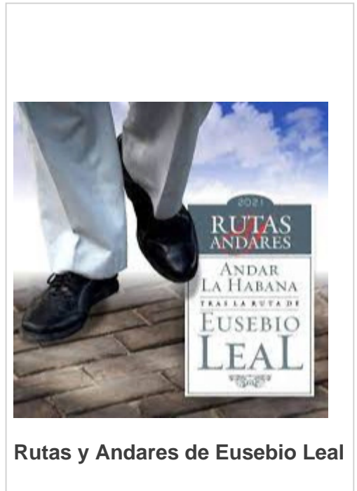
Rutas y Andares de Eusebio Leal

Tradujo ese concepto en práctica concreta al refundar escuelas para el aprendizaje de oficios que habían alcanzado entre nosotros un altísimo nivel en la albañilería, la ebanistería y en la elaboración de los preciosos enrejados, muchos de ellos desaparecidos en la actualidad por el abandono, la subestimación y hasta el pillaje.