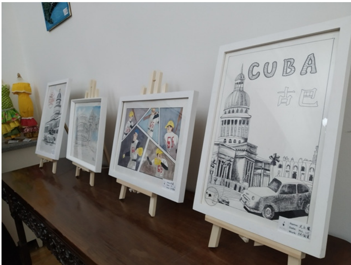
Muestra de niños chinos resalta bondades de Cuba

Beijing, 17 feb (RHC) Una exposición con dibujos infantiles se inauguró este jueves en China para rendir homenaje a Cuba y resaltar sus bondades como país rico en historia, cultura y naturaleza.