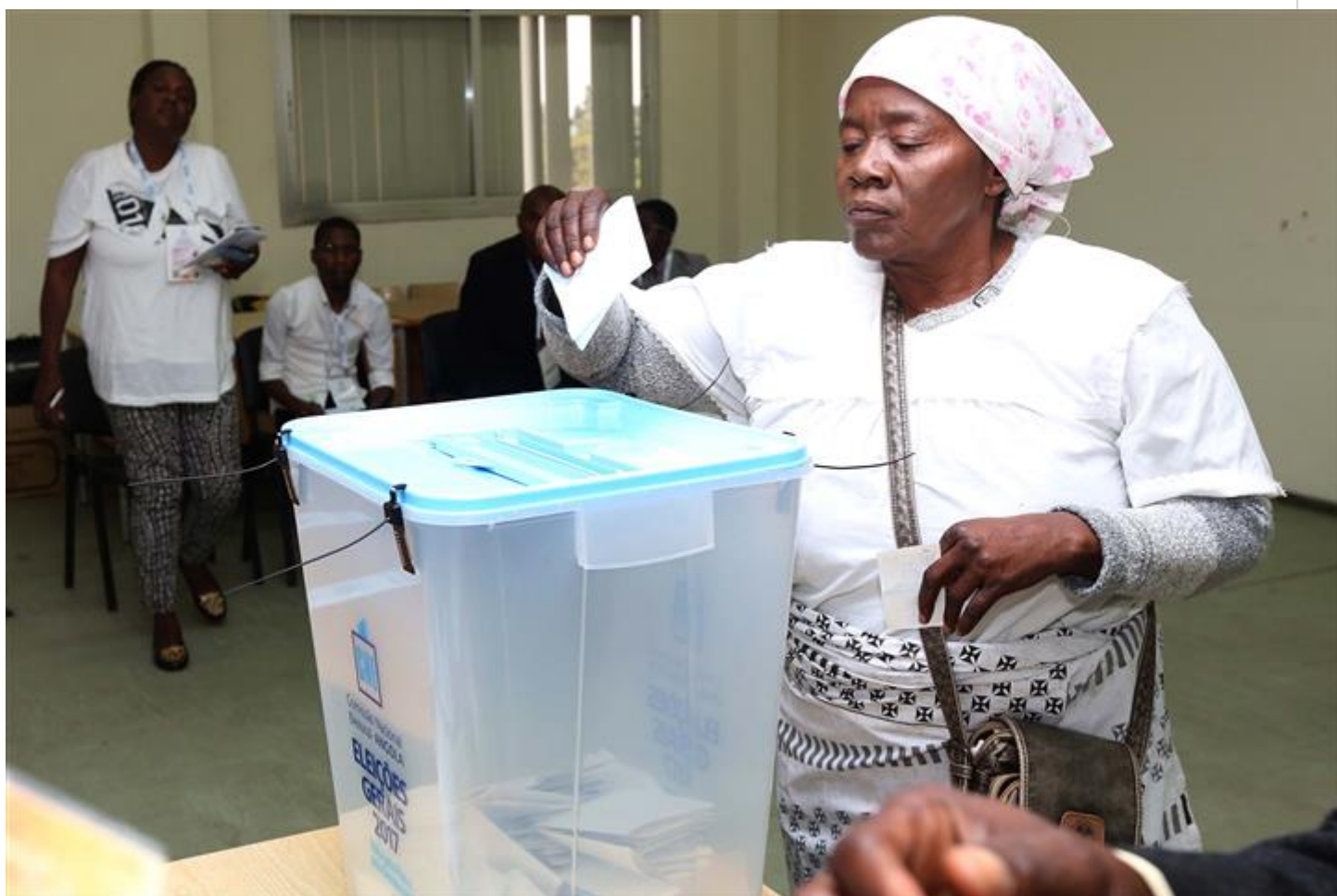
Presidente de Angola exhorta a masiva asistencia a las urnas.

Luanda, 24 ago (RHC) El jefe de Estado y de Gobierno en Angola, João Lourenço, exhortó a la asistencia masiva a las urnas, tras ejercer su derecho al sufragio en la localidad luandense de Ingombota.