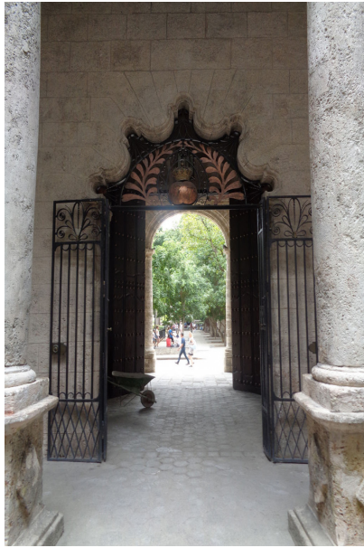
Palacio del Segundo Cabo

Precisa Pezuela que el Marqués reconoció que daría importancia y vida a la ciudad si en terrenos aledaños a la Plaza de Armas, que era entonces un lodazal, hacía construir la Casa de Gobierno y el palacio de la Intendencia. Terminado este último, se instalaron allí el Intendente y sus dependencias y la Administración de Correos. Más tarde, cuando creció el movimiento de las comunicaciones postales, la Real Hacienda se reservó el uso exclusivo del edificio y la oficina de Correos se trasladó para la residencia del Marqués de Arcos, en la Plaza de la Catedral.