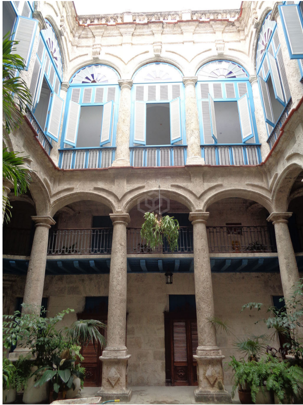
Palacio del Segundo Cabo