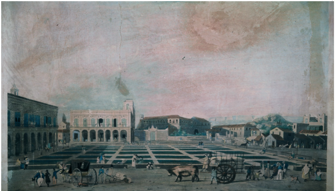
Plaza de Armas en la Colonia

Hace Roig a continuación referencia a documentos relativos al arreglo y embellecimiento de la Plaza de Armas en los que se detalla que en 1772 se estaba construyendo ya el edificio que sería conocido como del Segundo Cabo, y recuerda que cuando el Marqués expuso su proyecto ante el Cabildo aseveró que la Casa de Gobierno se edificaría «a imitación de la Real Casa de Correos, que se está construyendo magnífica en el lado norte...».