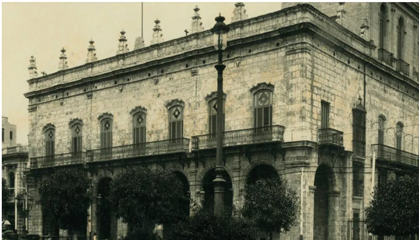
Palacio del Segundo Cabo