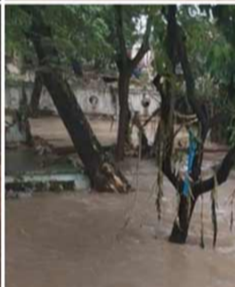
Manuel Marrero déplore les pertes humaines et matérielles dans l'est de Cuba