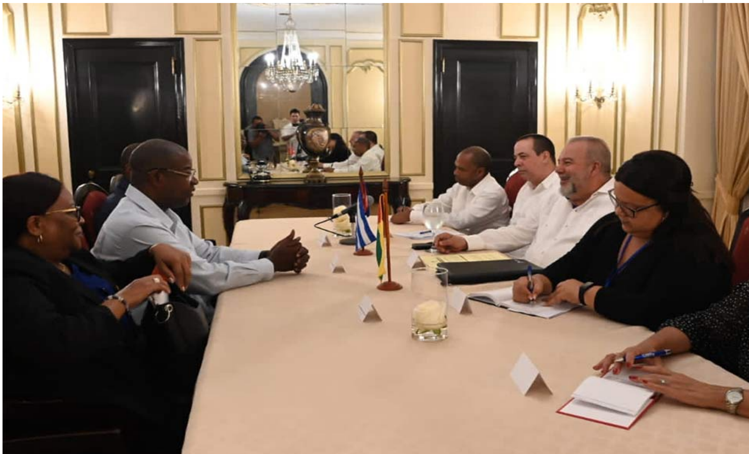
Manuel Marrero y Nuno Gomes Nabiam.

Marrero detalló en Twitter que Nuno Gomes Nabiam agradeció el apoyo de los cubanos en la lucha por la independencia de Guinea Bissau y enfatizó en las amplias posibilidades de cooperación entre ambos pueblos.