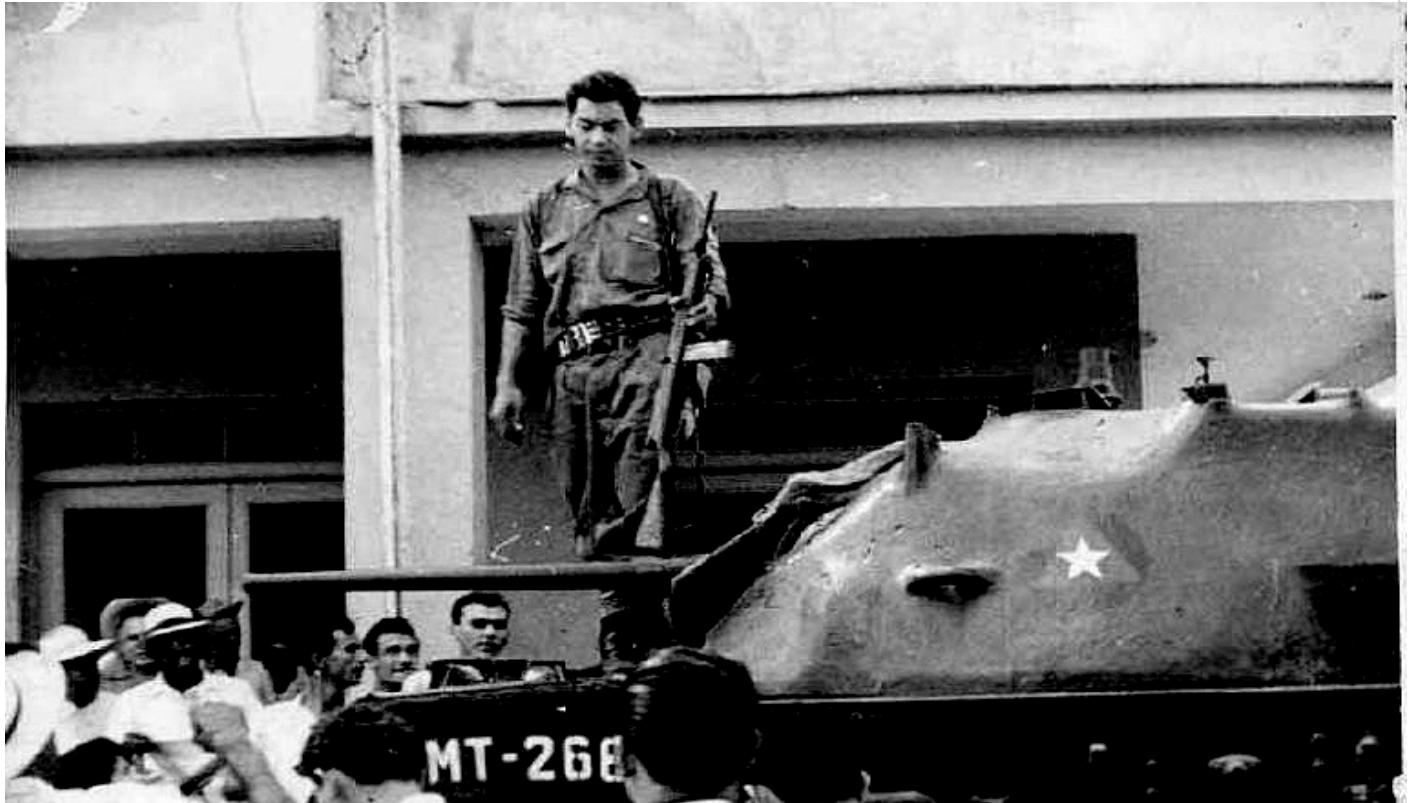
Fuerzas del ejército Rebelde

El 23, Camilo recibe la visita del Che, quien acababa de hablado con Fidel, en la Sierra Maestra, y recibe la buena nueva del repliegue del enemigo hacia el cuartel, en la actualidad el mayor centro hospitalario de Yaguajay.