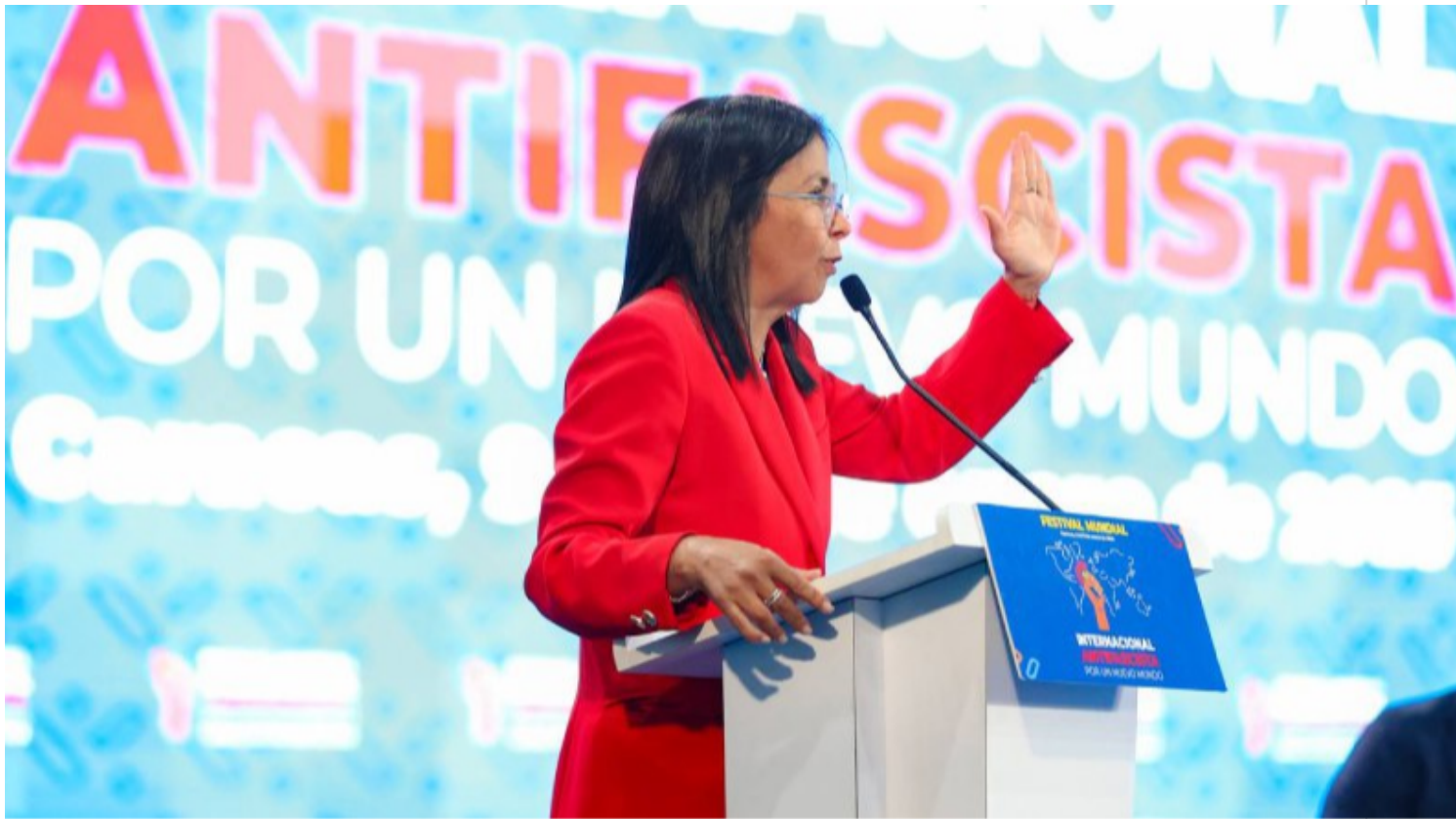
Delcy Rodríguez en la inauguración del Festival Mundial de la Internacional Antifascista.